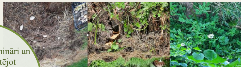
Attēls. Permakultūra-Sienā audzēti kartupeļi, biedrība «Zaļā krūze»

Organizē pašvaldība, piesaistot jomas ekspertu